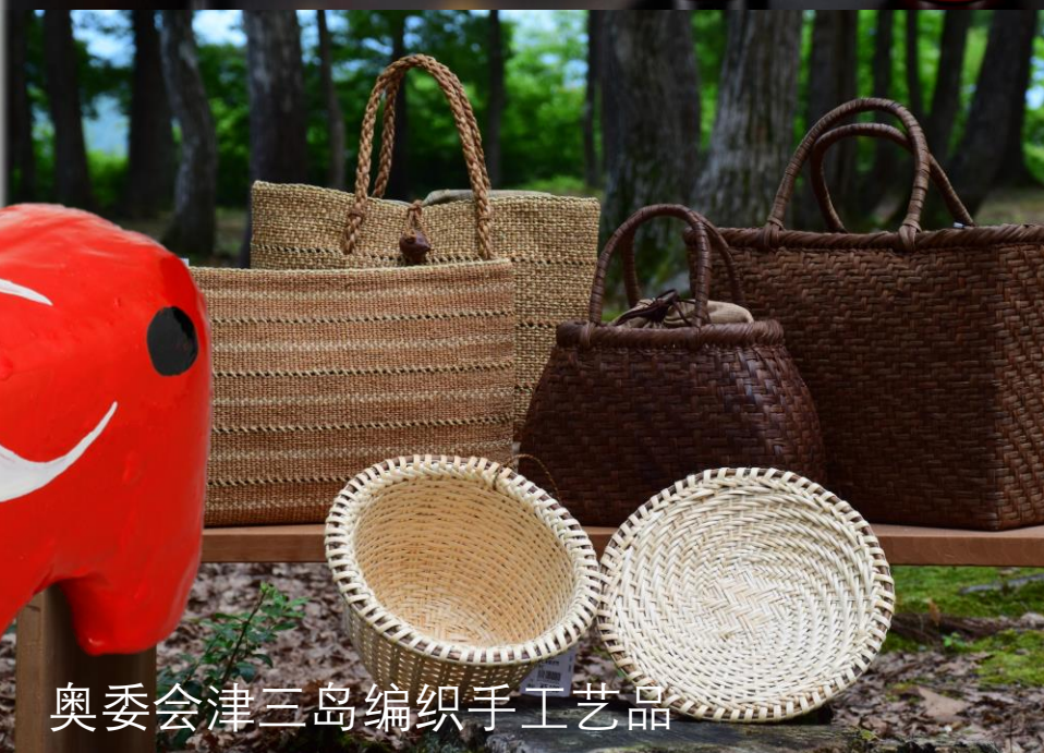
奥委会津三岛编织手工艺品