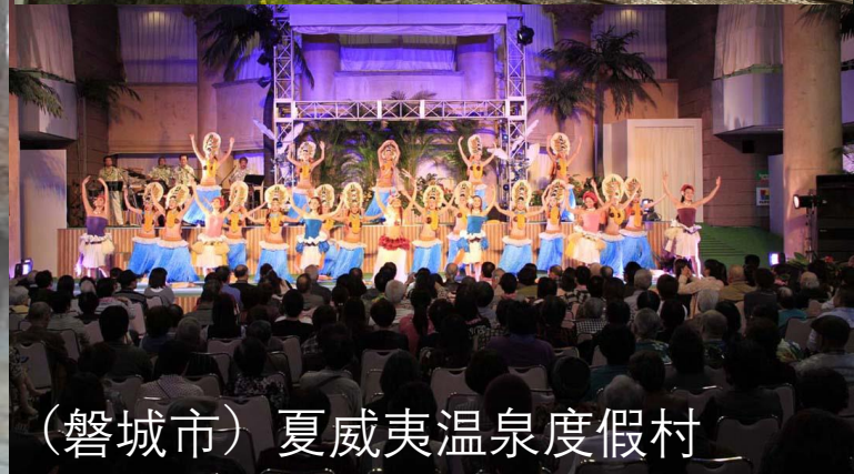
(磐城市) 夏威夷温泉度假村