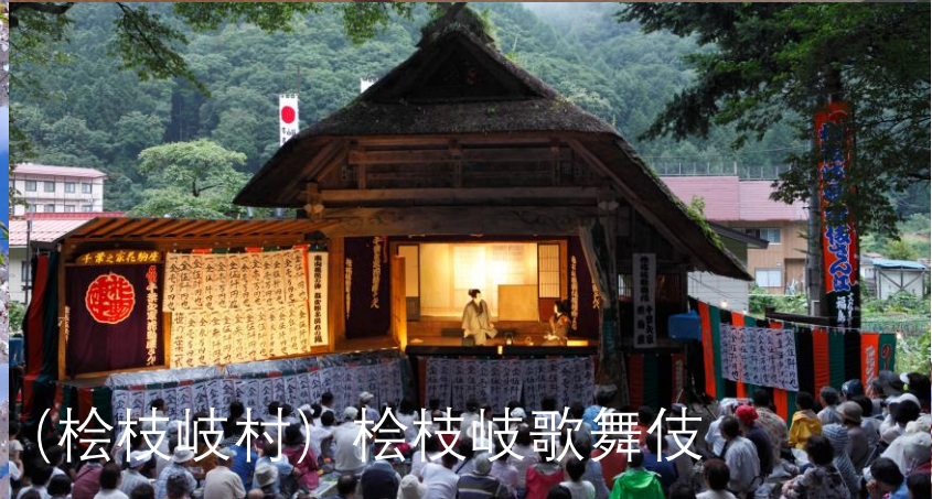
(桧枝岐村) 桧枝岐歌舞伎