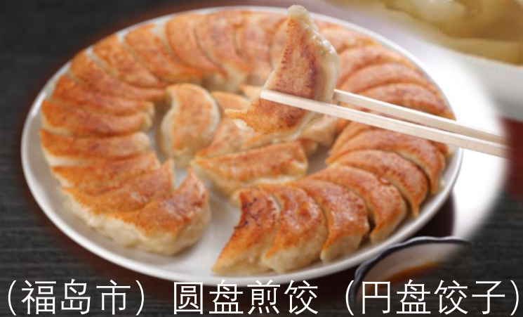
(福岛市) 圆盘煎饺 (円盘饺子)