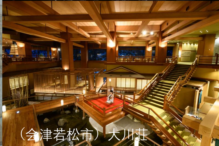
(会津若松市) 大川荘