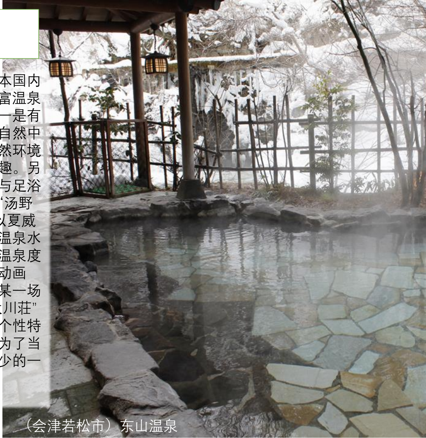
(会津若松市) 东山温泉

福岛县拥有在日本国内也十分罕见的丰富温泉资源。其特征之一是有不少地处静谧自然中的秘汤，能在自然环境中享受温泉的乐趣。另外，以茅葺房顶与足浴为特色的车站——“汤野上温泉车站”；以夏威夷为原型，使用温泉水打造而成夏威夷温泉度假村；又与人气动画《鬼灭之刃》中某一场景高度相似的“大川荘”等等，这些极具个性特色的设施旅馆成为了当地魅力中不可缺少的一部分。