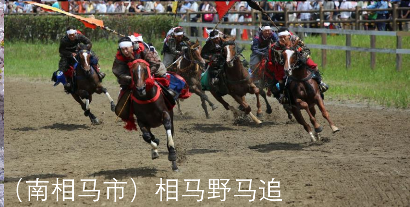
(南相马市) 相马野马追