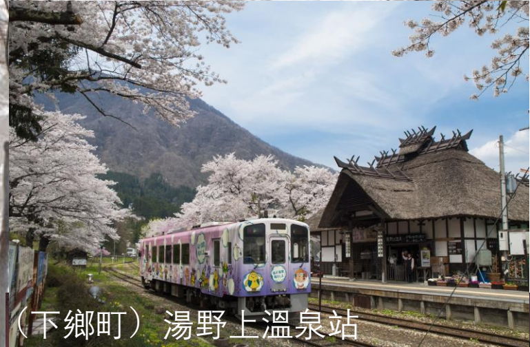
(下郷町) 湯野上温泉站