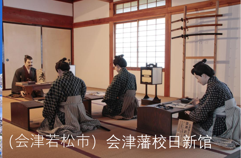
(会津若松市) 会津藩校日新馆