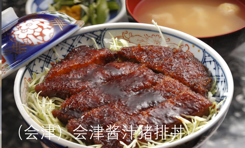
(会津) 会津酱汁猪排丼