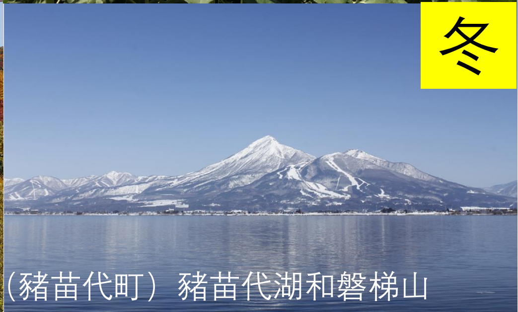
(猪苗代町) 猪苗代湖和磐梯山